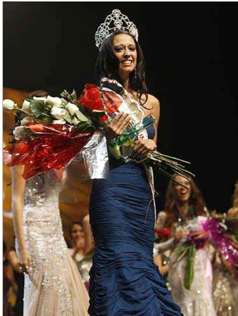
Cô hy vọng sẽ trở thành người Canada thứ ba giành vương miện Hoa hậu Hoàn vũ, sau Karen Dianne Baldwin (1982) và Natalie Glebova